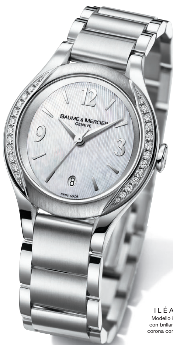
IL ÉA Modello in acciaio con brillanti, corona con un brillante